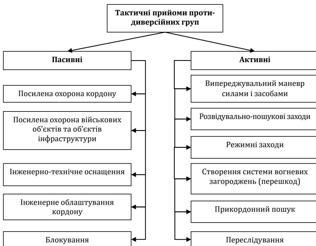
Рис. 1. Тактичні прийоми протидиверсійної боротьби

плексу попередньо визначених оперативно-розшукових, режимних, розвідувально-пошукових заходів, а також дій, спрямованих на захист населення прикордоння, органів місцевого самоврядування та охорону важливих об'єктів критичної інфраструктури, які охоплюють тактичні заходи практичного спрямування (детальніше див. рис. 1).